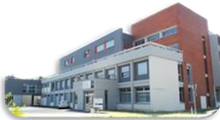
Centre Hospitalier de Graulhet